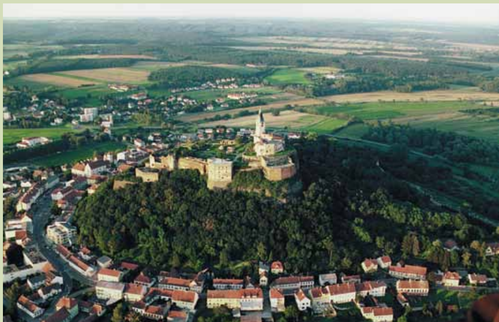
Energiestadt pur: die Gemeinde Güssing im österreichischen Burgenland.

> Bis vor 20 Jahren ging es den Güssingern wie so vielen im Burgenland, dem ärmsten Bundesland Österreichs: Arbeit mussten sie in Wien und Graz suchen, denn die klein strukturierten landwirtschaftlichen Flächen generierten kein grosses Einkommen. Die vorhandenen Ressourcen der Region (mehr als 40% Waldanteil) wurden kaum genutzt. Doch 1990 beschloss der Gemeinderat der 27 000-Einwohner-Stadt, aus der fossilen Energieversorgung auszusteigen. Es sollte eine Strategie der dezentralen, lokalen Energieerzeugung mit allen vorhandenen erneuerbaren Ressourcen der Region verfolgt werden. Auf dem Weg zur energieautarken Stadt konnte Güssing bald erste Erfolge verbuchen: Nachdem ein Energiekonzept erstellt worden war, wurden alle Gebäude im Stadtzentrum saniert, die Ausgaben für Energie wurden beinahe halbiert. Später wurden eine Rapsöl-Biodieselanlage, zwei Biomasse-Nahwärmenetze sowie die damals grösste Biomasse-(Fernwärme-)Anlage Österreichs errichtet. 2001 nahm auch das Biomassekraftwerk Güssing seinen Betrieb auf, das heute Strom und Wärme erzeugt. Mittlerweile nennt sich die Region ökoEnergie-