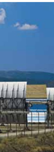
diesem Bild Projekts.

Gerade mit den Gebäudesanierungen könnten wir Energie sparen. Wir leiden ein bisschen unter den alten Gebäuden, bei denen eine Sanierung schwierig ist. Aber Schulen beispielsweise wurden bereits nach Minergiestandard saniert. Auch beim Langsamverkehr sehe ich noch Potenzial.