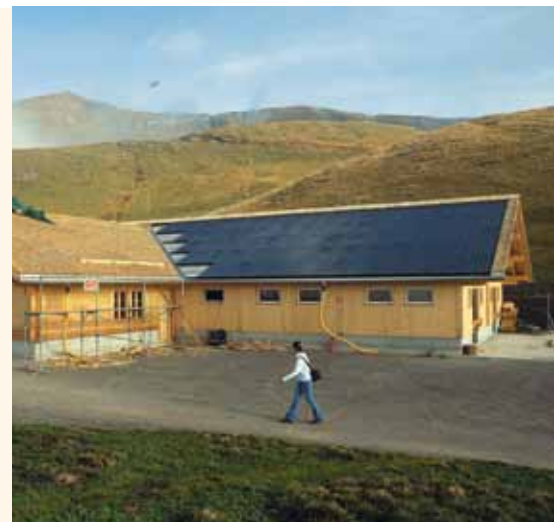
Das Dach der Rinderhütte eignet sich ideal zur Produktion von Sonnenstrom.