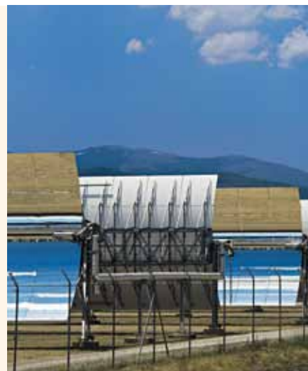
Thermische Solarkraftwerke (wie auf in Spanien) bilden das Herzstück des