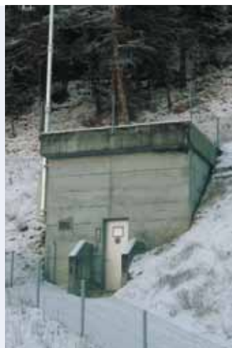
Das Turbinenhaus wurde oberhalb des Trinkwassereservoirs Budilji erstellt.

In einem zweiten Schritt sollte im April ein weiteres Leuker Kraftwerk, das Laufkraftwerk Oberbann, die «naturemade star»-Zertifizierung erhalten.