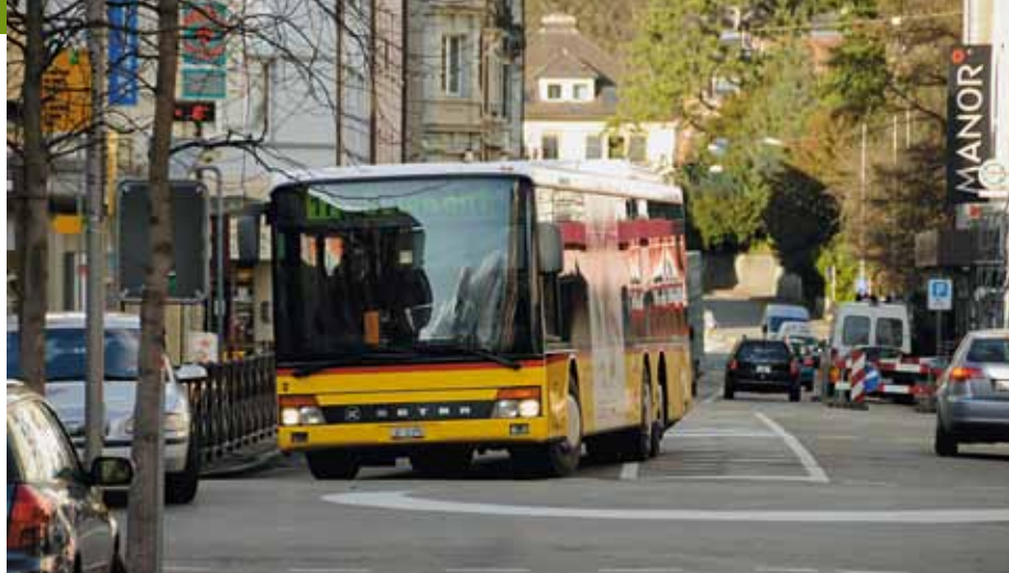
Das gesteigerte Angebot im öffentlichen Verkehr wird in Delémont rege genutzt.

Während sich die Delsberger Politiker und die Stadtverwaltung mit Auszeichnungen brüsten dürfen, scheint die Bevölkerung über diese zwar glücklich zu sein, doch sieht sie auch Grenzen der Ausgaben für die Nachhaltigkeit. Als die Stadt die Strompreise erhöhen wollte, um eine neue Stelle für nachhaltige Entwicklung im Zusammenhang mit dem Label «Energistadt» zu schaffen, wurde dies von der Bevölkerung zurückgewiesen. «Das vorgebrachte Argument war: Was ihr erreicht habt, war auch ohne diese zusätzliche Stelle möglich», erzählt Jaquier.