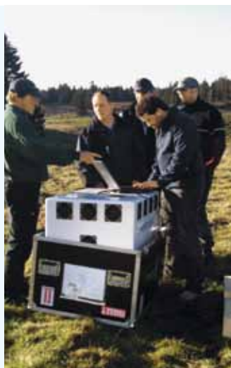
Lidar: Lasertechnologie im Dienste der Windmessung.