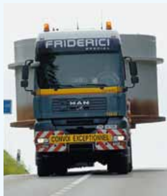
Ein 19 Tonnen schwerer Mastfuss wird auf die Jurahöhen transportiert.

Im Windkraftwerk Juvent sind die Fundamente für acht weitere Turbinen plangemäss fertiggestellt worden.